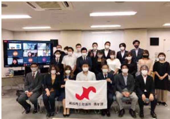
令和3年5月度定例会 講師例会 SDGsについて