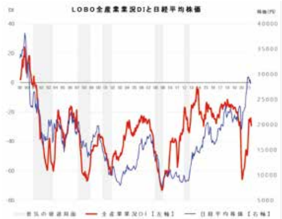
※DI=(増加・好転などの回答割合)-(減少・悪化などの回答割合) ※業況 採算:(好転)-(悪化) ※売上:(増加)-(減少)

先行き見通しDIは、▲32.3 (今月比▲2.9ポイント)です。ワクチン接種の進展による経済活動正常化に期待する声が聞かれる一方で、新型コロナウイルスの感染収束が見通せず、長引く受注・売上減少や客足回復の遅れから、業績悪化の継続を懸念する企業は多いです。また、世界的な半導体不足による生産調整や、鉄鋼などの原材料価格上昇分の価格転嫁の遅れなどもあり、先行き不透明感は強まっており、厳しい見方が続きます。