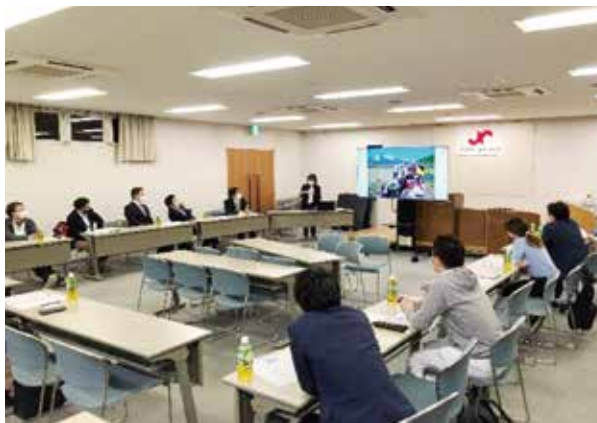
令和3年4月度定例会 会員オリエンテーション

コロナ禍により事業体制も変化し、会議や定例会では密にならないようにハイブリッド開催で行い、感染症対策をしっかりと行いながら事業活動を進めています。